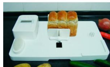
Tabla de ayuda para la cocina. Ideal para personas con eficiencia de agarre o para trabajar con una sola mano. Esta tabla puede fijar comida, botes, botellas, etc. Antes de cortar se puede rallar, pelar, lavar la comida. El pan queda fijado sin moverse para poder cortarlo con facilidad. Posee ventosas en las base para su fijación. Dimensiones: Grosor 3,5 x largo 50 x ancho 30 cm.