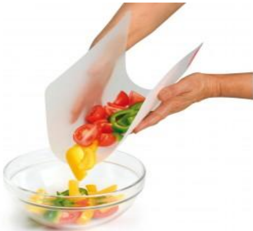
Tabla de cortar flexible. Color transparente blanco.