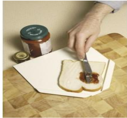
Tabla de untar

La tabla de untar es apta para ser utilizada con una sola mano. Unte el pan más fácilmente gracias a este soporte de plástico. Los tacos antideslizantes y un borde que se ajusta a la mesa mantienen esta tabla en su lugar. Apto para lavavajillas (bandeja superior).