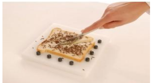
Tabla de cortar de plástico con ocho pernos en la parte superior y cuatro tacos antideslizantes en la parte inferior. Medidas: 18 x 18 cm.